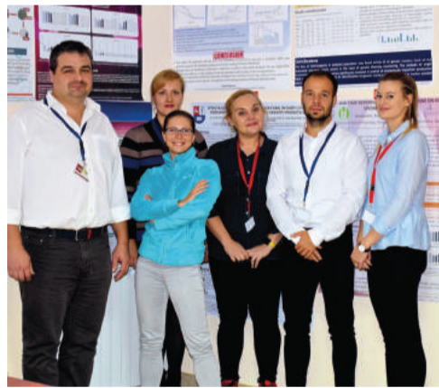
Vedeckí pracovníci SPU mali vo svojom odbore početné zastúpenie

Prezentovaných bolo 245 prednášok a tisíc posterov, rozdelených do 14 sekcií. Rôznorodosť príspevkov dokazuje 13 živočíšnych druhov a nespočetné množstvo druhov a odrôd rastlín aplikovaných vzhľadom na ciele výskumu. O zintenzívnenie programu sa postarali plenárne prednášky a odborný výklad prezentujúcich firiem, ako aj diskusie k príspevkom či sekciám.