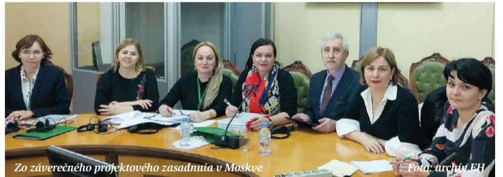
Zo záverečného projektového zasadnutia v Moskve