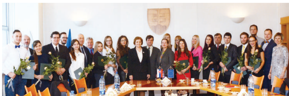
Ocenení študenti s vedením SPU a fakúlt

a rozvoj univerzity. V úvode pripomenula udalosti, ktoré viedli k vyhláseniu Medzinárodného