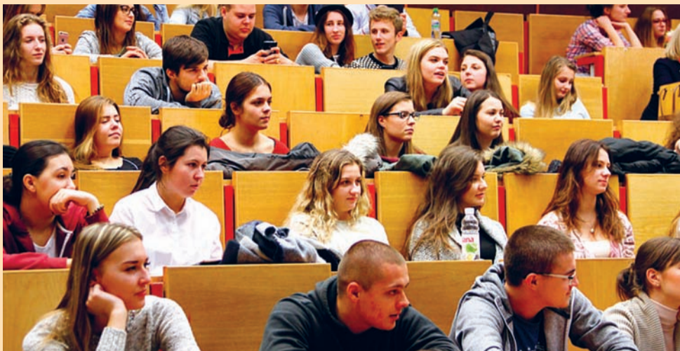
Stredoškolači sa mohli oboznámiť aj so študijnými programami FEM

Podujatie Deň vysokoškolačka predstavuje stredoškolačkom plnohodnotný deň na Fakulte ekonomiky a manažmentu SPU a dáva im príležitosť zažiť deň ako „riadny vysokoškolač“.