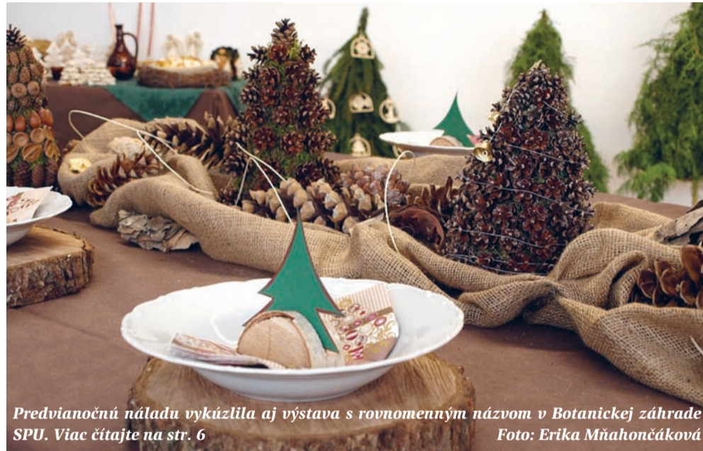
Predvianočnú náladu vykúzlila aj výstava s rovnomenným názvom v Botanickej záhrade SPU. Viac čítajte na str. 6