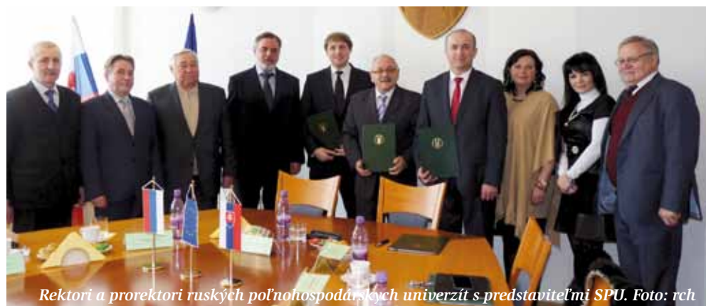
Rektori a prorektori ruských poľnohospodárskych univerzít s predstaviteľmi SPU.

SPU v Nitre získala ďalších partnerov pre spoluprácu - Kabardino-Balkarskú štátnu poľnohospodársku univerzitu a Marijskú štátnu univerzitu.