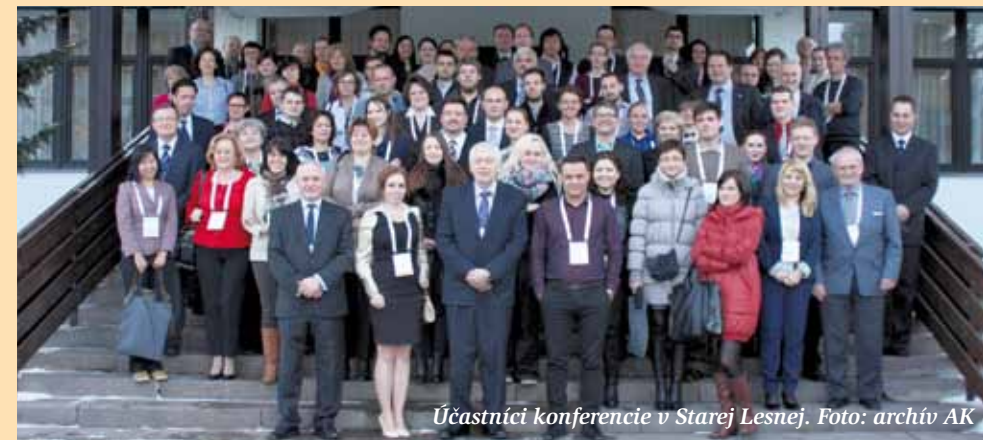
Účastníci konferencie v Starej Lesnej.