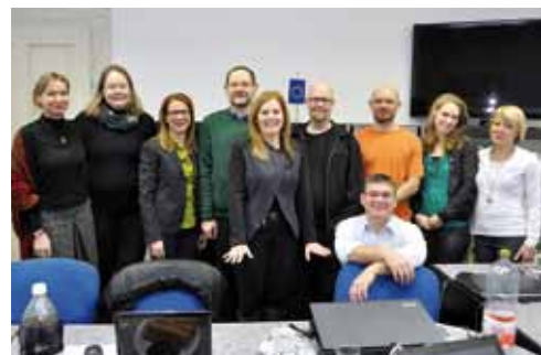
Účastníci workshopu na Katedre práva.