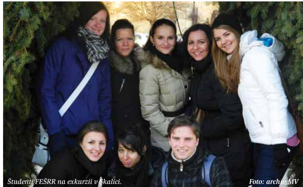
Študenti FEŠRR na exkurzii v Skalici.

Skalica je aj mestom kultúry, kde sa už tradične konajú rôzne festivaly: Skalické dni - festival tradície, hudby a zábavy či Trdlofest - deň trdelníka a vína. Vďaka schopným a ochotným ľuďom má mesto medzinárodný charakter a rozvíja sa vďaka rôznym projektom v cestovnom ruchu. Napr.