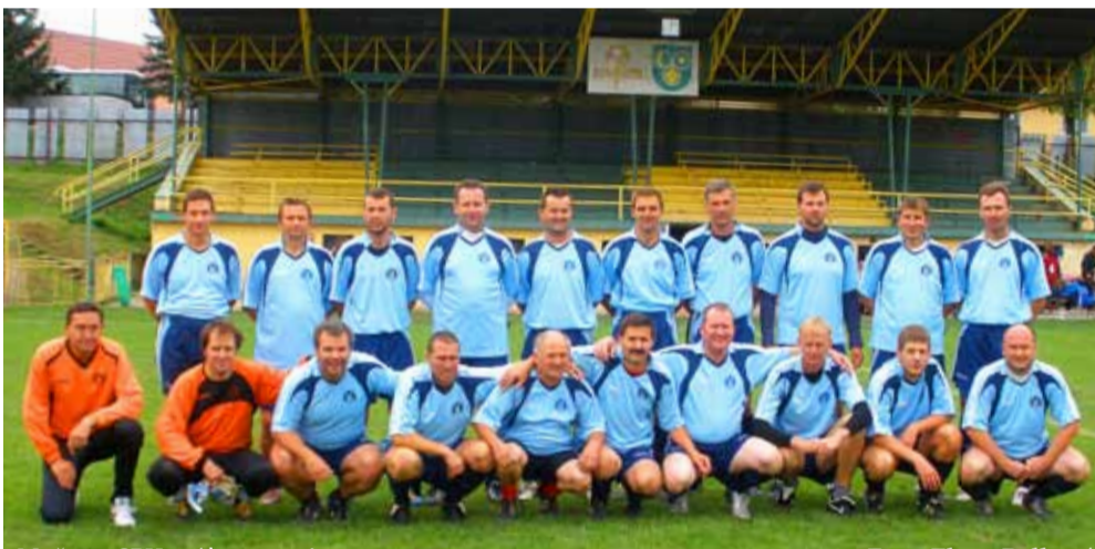
Mužstvo SPU - víťaz turnaja.