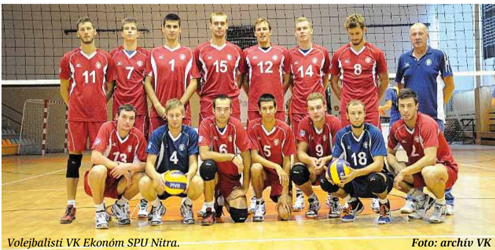
Volejbalisti VK Ekonóm SPU Nitra.