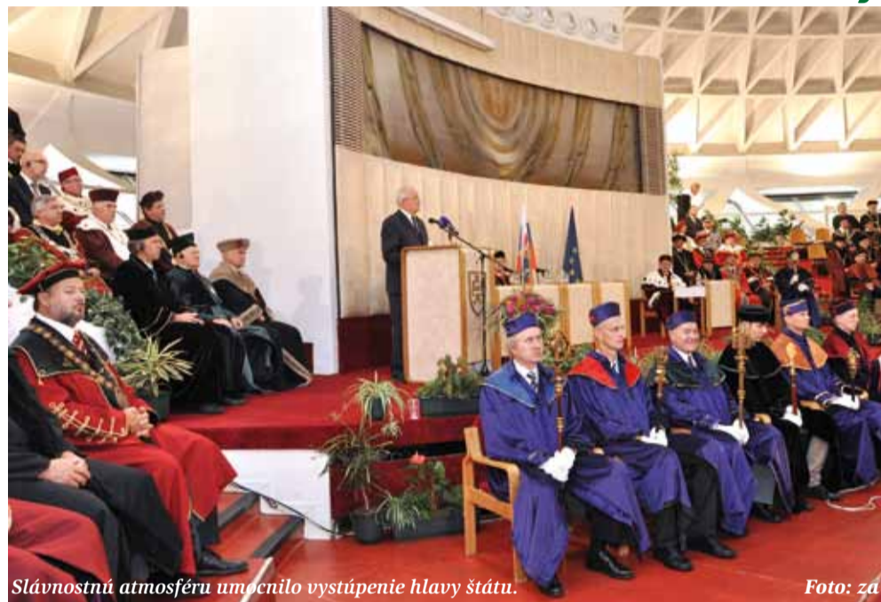
Slávnostnú atmosféru umocnilo vystúpenie hlavy štátu.