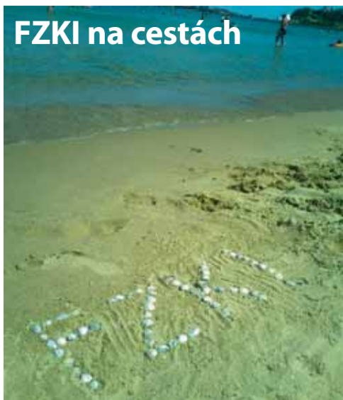
Zo Slnčného pobrežia v Bulharsku.