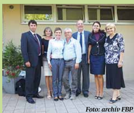
Prvé absolventky medzinárodného doktorandského programu Welfare, biotechnológie a kvalita živočíšnej produkcie so svojimi pedagógmi.