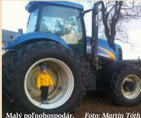
Malý poľnohospodár.

Podarilo sa vám zachytiť nejakú veselú či kurióznou situáciu? Podelte sa o svoje fotoúlovky s čitateľmi Poľnohospodára a pošlite ich spolu s vtipným textom na našu mailovú adresu: redakcia@polnohospodar.sk . Autorov najlepších snímok odmeníme.