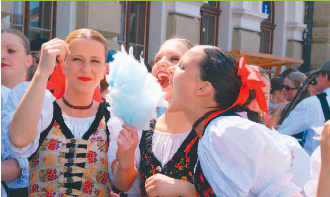
Sviatok folklóru Akademická Nitra 2010 začne v utorok 6. júla a potrvá do štvrtka 8. júla. Čítajte na 4. a 5. strane.