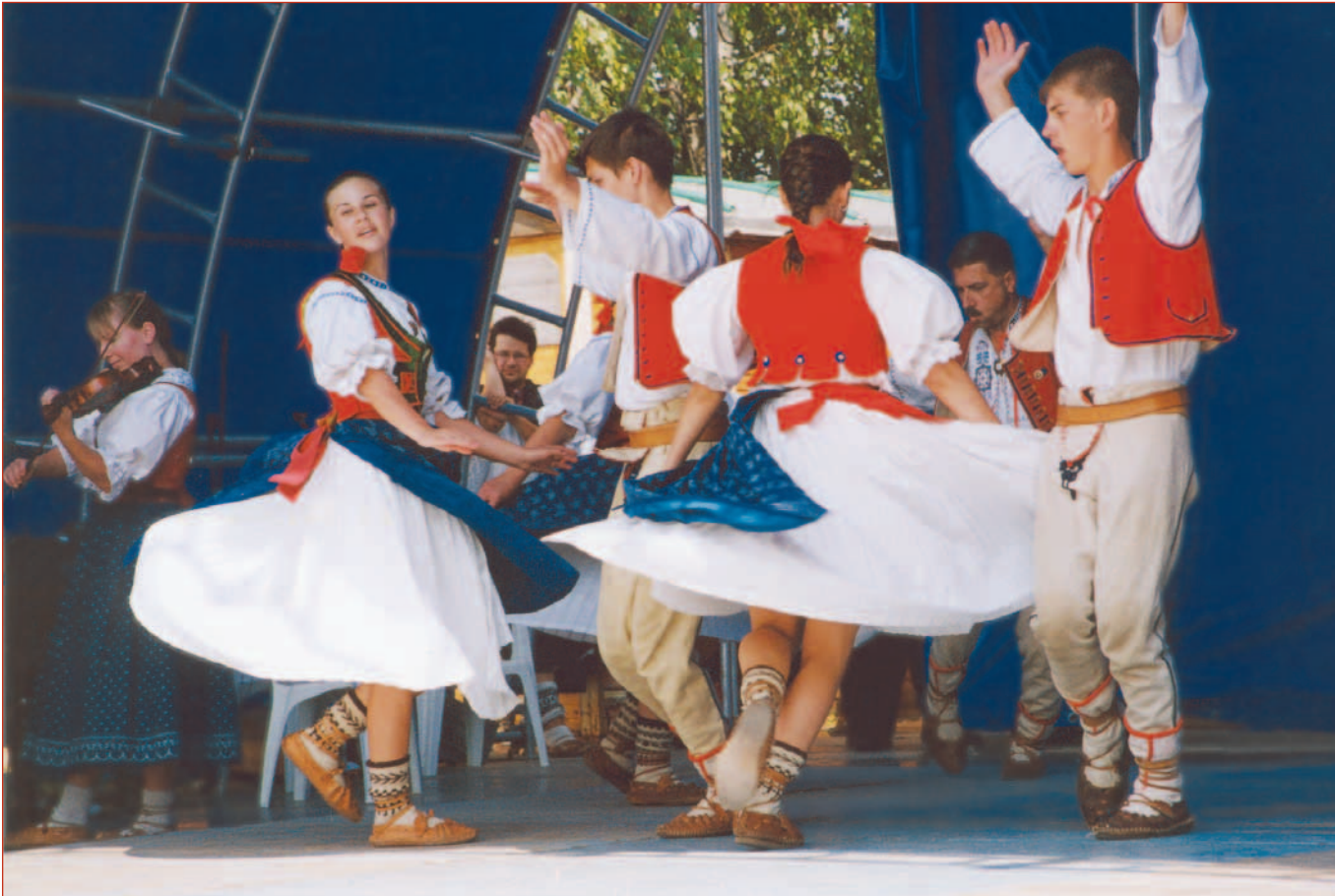
Tancuj, tancuj, vykrúcaj...