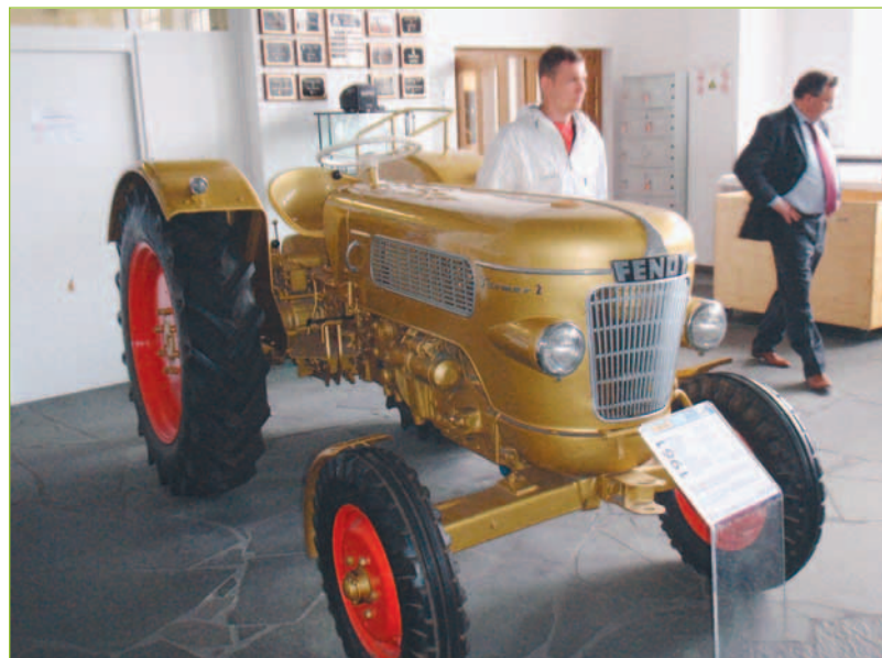
FENDT je hrdý na svoju históriu.