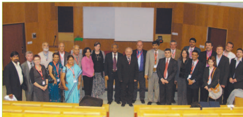
Zahraniční hostia MVD v spoločnosti slovenských kolegov.