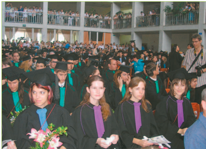
Nie je diplom ako diplom! Naše študentky na promócií v Gödöllő.

lujeme im a veríme, že dobre zúročia nadobudnuté vedomosti a skúsenosti.