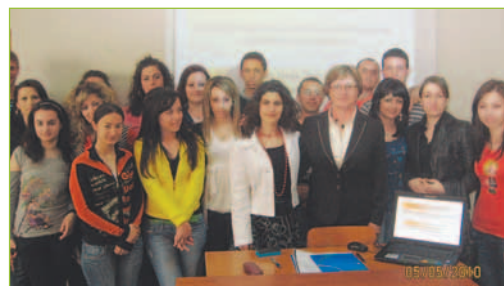
Po prednáške so študentmi na University of Korçe.