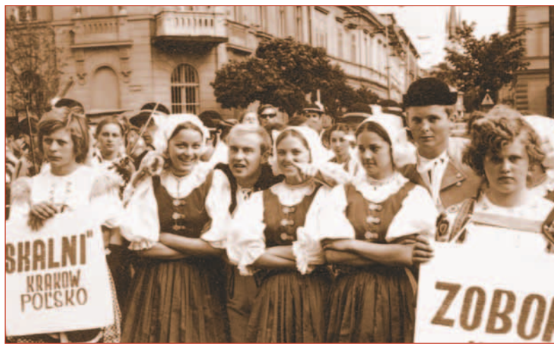
Akademická Nitra je napriek svojmu „veku“ stále mladá a krásna. Na snímke členovia súboru Zobor vo festivalovom sprievode z roku 1972.

Akademický Zvolen, ako aj Medzinárodný akademický festival folklórnych súborov, ktorý sa organizoval vo Zvolene každý druhý rok, začali koncom 80. rokov „morálne zastarávať“. Najväčším nedostatkom boli veľmi zlé priestory zimného