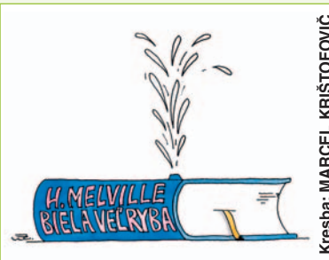
Kresba: MARCEL KRÍŠTOFOVIČ