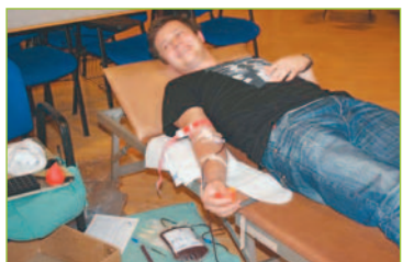
Valentínska kvapka krvi oslovila predovšetkým mladých ľudí.

Odber krvi, ktorý sa uskutočnil 17. 2. 2010 v Študentskom domove Antona Bernoláka, zorganizoval miestny spolok Mládeže SČK pri SPU spolu