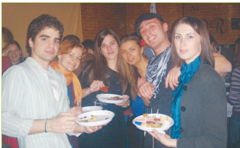
Kolko ľudí, toľko chutí...

Zástupcovia každej krajiny pripravili stôl s tamojšími pochútkami a špecialitami. Zahanbíť sa nedali ani zahraniční študenti z UKF, ktorí sa pridali tiež a prichystali výborné pohostenie. Stoly sa zaplnili rôznymi zaujímavými jedlami a každý sa snažil vcítiť do atmosféry danej krajiny. Jedlo rozvoniavalo a z dobrôt na stoloch pomaly začalo ubúdať. Výber bol široký, takže si každý mohol nájsť niečo, čo ulahodilo jeho chuti. Na stoloch sa objavilo jedlo zo Španielska, Poľska, Talianska, Turecka, Írska, Maďarska, Lotyšska a nechýbal ani český a slovenský stôl. Samozrejme, pripravili sme aj naše tradičné bryndzové halušky, ktoré boli výborné, no predsa len je to špecifické jedlo a nie všetkým cudzincom chutilo. Potvrdilo sa teda pravidlo - sto ľudí, sto chutí. Na začiatok sme si pripili tradičnou slovenskou hruškovnicou a rovnako sme mali možnosť ochutnať aj výborné tokajské víno, ktoré nám ponúkol