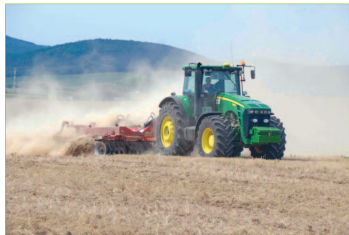
Pôdoochranné spracovanie pôdy.