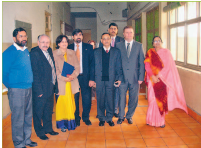
S predstaviteľmi Guru Gobind Singh Indraprastha University New Delhi.

S istotou môžeme potvrdiť, že každý, kto navštívi Indiu, prežije tzv. kultúrny šok, tak často spomínaný v teórii medzinárodného podnikania. Záleží na jednotlivcovi, ako dlho bude trvať a ako rýchle sa dokáže adaptovať. Napríklad, francúzski študenti, študujúci na Birla Institute of Management Technology tvrdia, že sa dokázali pomerne rýchle adaptovať, chápať „indickú angličtinu“ pri rozhovore s bežnými ľuďmi a momentálne sú svojím pobytom nadšení. Bude to pre nich neocentelná hodnota, ak sa budú uchádzať o manažérsku pozíciu v multinacionálnej spoločnosti. A po prvom slovíčku „namaste“ (pozdrav, ktorý sa môže v rôznych častiach Indie vy-