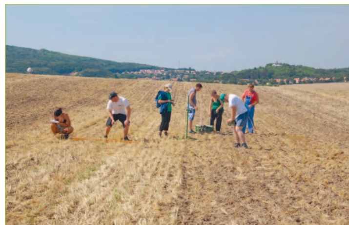
Meranie pôdnych vlastností na parcelách VPP v Koliňanoch.

„Aplikácia informačných technológií na zvýšenie environmentálnej a ekonomickej udržateľnosti produkčného agrosystému“