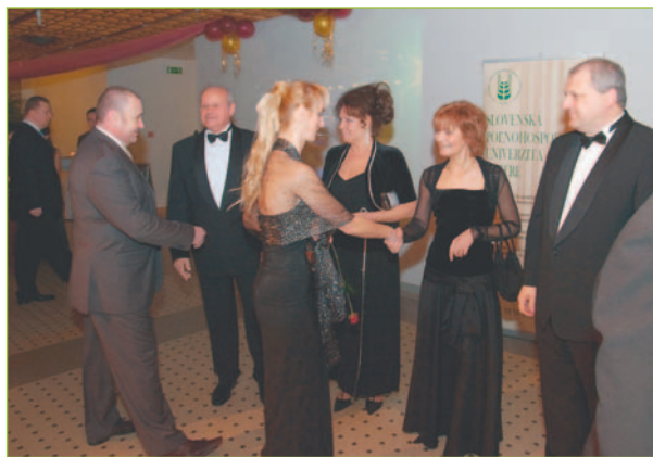
Už tradične v úvode plesu hostí vítali rektori oboch univerzít s manželkami.