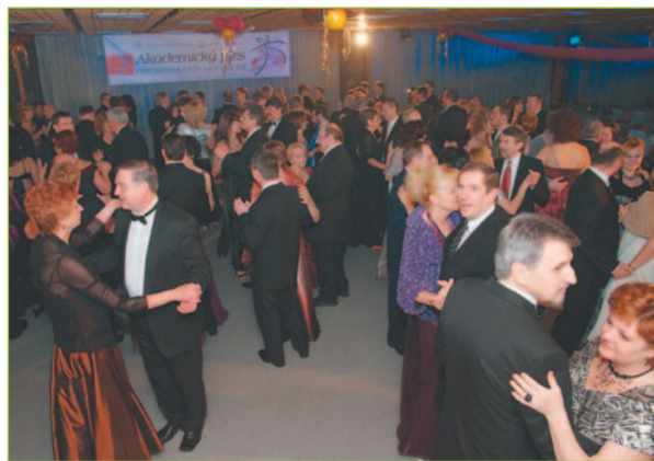
Počas celého večera panovala na parkete príjemná atmosféra.