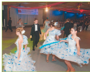
Osem párov tanečnej skupiny detských spoločenských tancov Talentiček z Nitry očarilo choreografiou na melódie kráľa valčíkov.