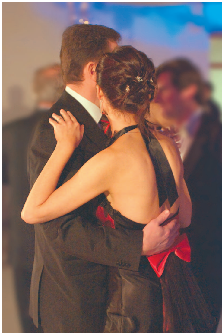
Do tretice všetko dobré! Krásny večer, príjemnú zábavu, radosť a pohodu, to všetko priniesol tohtoročný akademický ples nitrianskych univerzít.