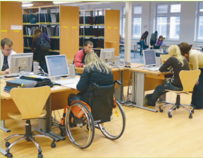
Naša knižnica vyriešila odstránenie prístupových bariér pre používateľov so špecifickými potrebami.

ný bol samotný prístup do novej budovy, ktorý sa musel pre ľudí s pohybovými problémami riešiť výťahom, pretože všetky služby sú sústredené na 1. poschodí. Už pri koncipovaní univerzálnej študovne, najmä pri rozmiestňovaní regálov s knihami, sa zohľadňovala potreba pohybu medzi nimi, napríklad na vozíčku. Nepodarilo sa