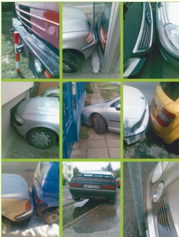
Šikovní šoféri v uliciach Nitry.

Podarilo sa vám zachytiť nejakú veselú či kurióznu situáciu? Podajte sa o svoje fotoúlovy s čitateľmi Poľnohospodára a pošlite ich spolu s vtipným textom na našu mailovú adresu: redakcia@polnohospodar.sk. Autorov najlepších snímok odmeníme.