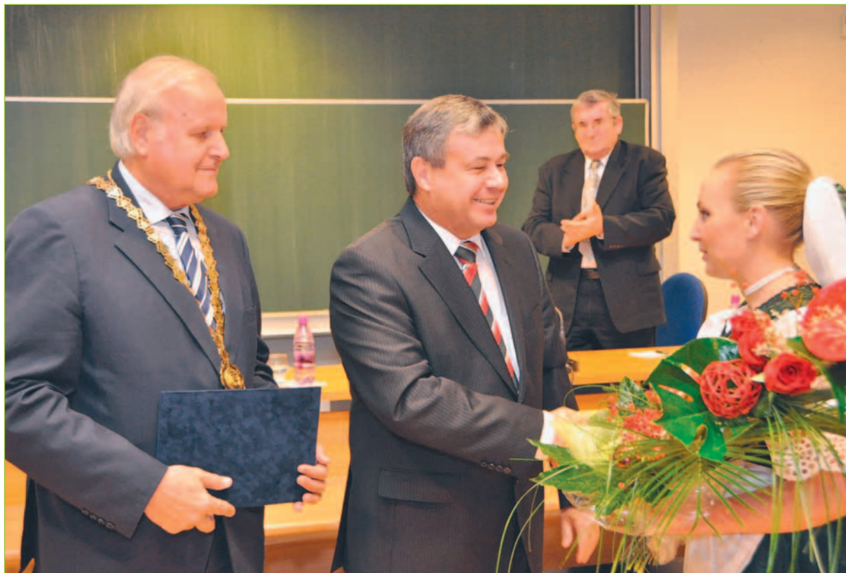
V predvianočnom týždni navštívil našu univerzitu minister školstva Ján Mikolaj, aby rektorovi Mikulášovi Látečkovi slávnostne odovzdal dekrét vysokej školy univerzitného typu.

27. 1. 1829 - narodil sa Ján Botto , predstaviteľ štúrovcov, národný buditeľ.