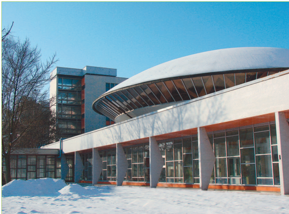
Radostné a pokojné vianočné sviatky, šťastný a úspešný nový rok 2010!

15. 12. 1859 - narodil sa Ludvík Lazar Zamenhof , poľský lekár, autor umelého jazyka esperanto.