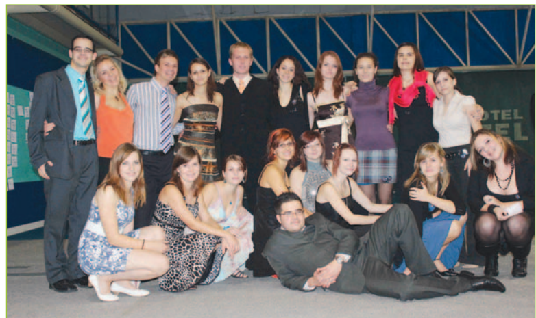
AIESEC-ári na konferencii Highway v Poprade.

The international platform for young people to discover and develop their potential