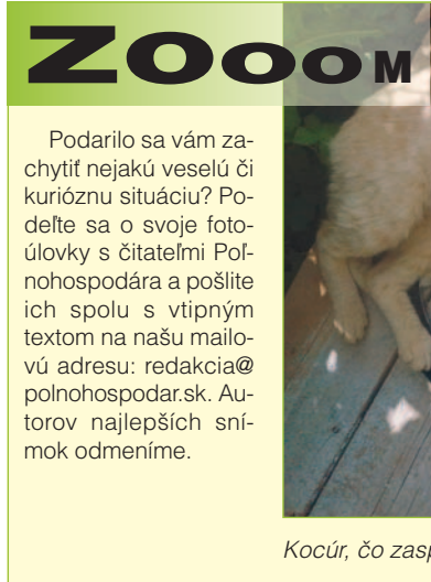
Kocúr, čo zaspal dobu.