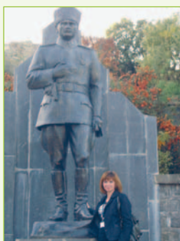
Socha Atatürka, zakladateľa Tureckej republiky, sa vyníma v každom tureckom meste.