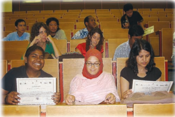
Radosť z diplomu...