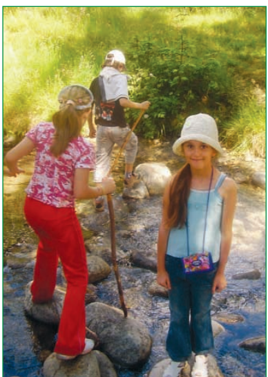
Kto sa prvý namočí? Malé turistky v Pribyline...