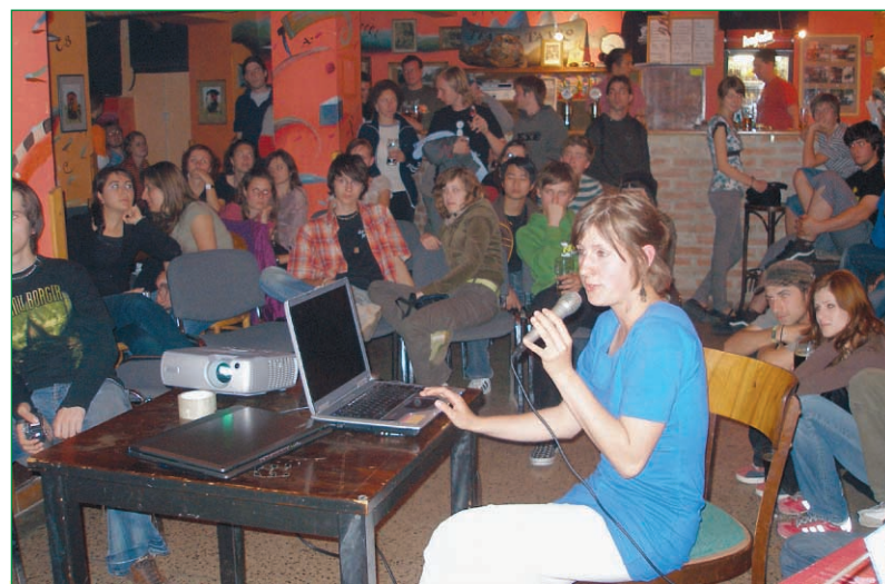
Klub Tatra ako stvorený pre myšlienku „closer to each other“.

Záhradný trpaslík vyvrcholil pri tombole, ktorej hlavnou cenou bol, ako ináč, sadrový a putovný trpaslík.