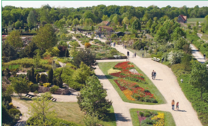
Park záhrad v Bad Zwischenahne.