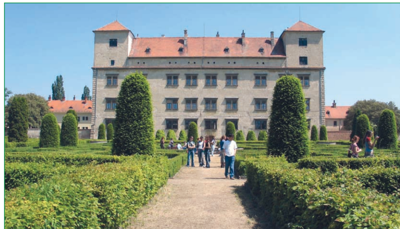
Renesančný zámok Bučovice neďaleko Vyškova na Morave patrí medzi najkrajšie v strednej Európe.