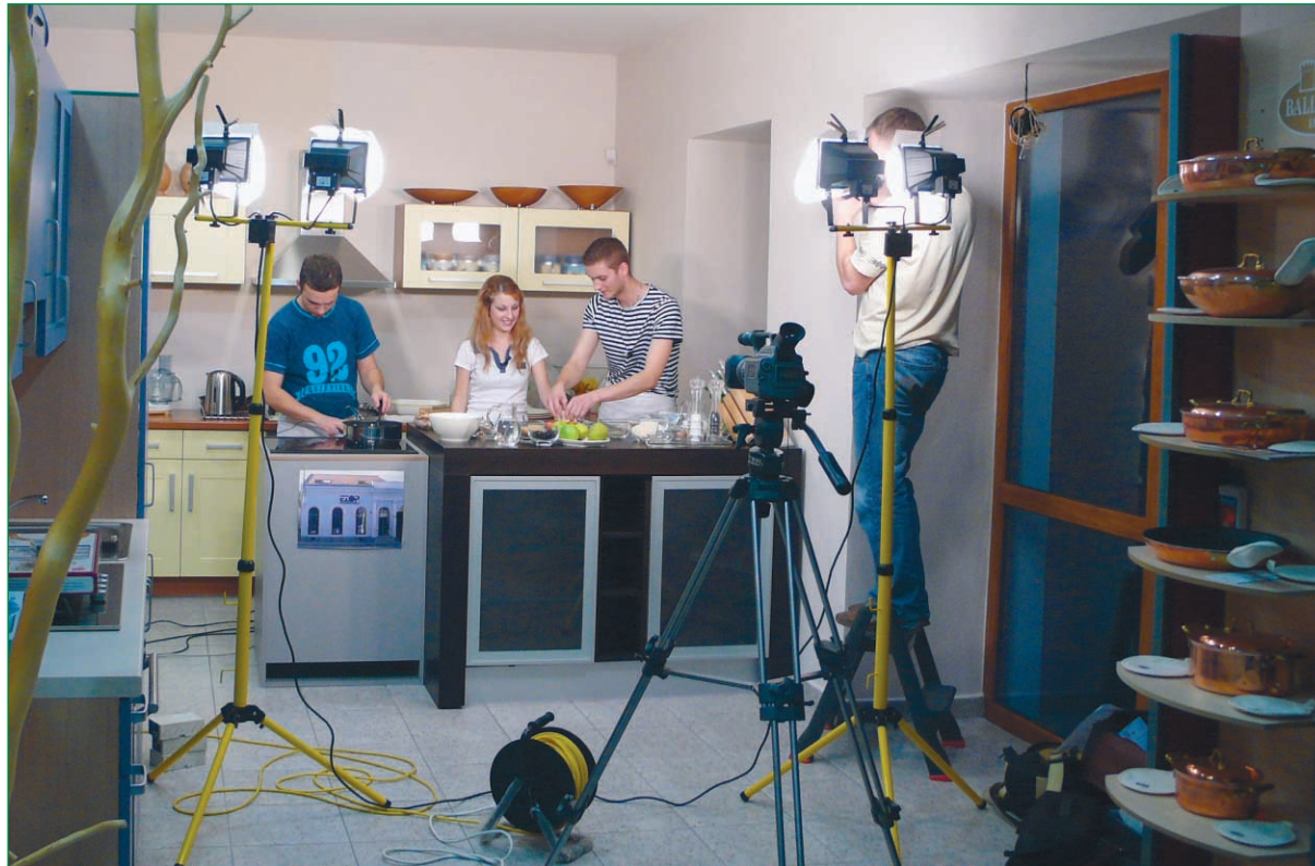
V kuchynskom štúdiu sa „varí“ relácia o varení. Čítajte na 3. strane.