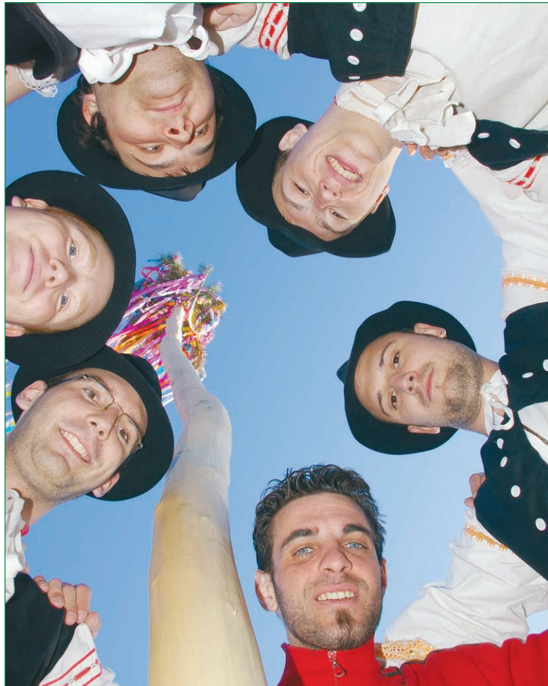
„Stávaj, dievča, hore, sadíme ti máje...“