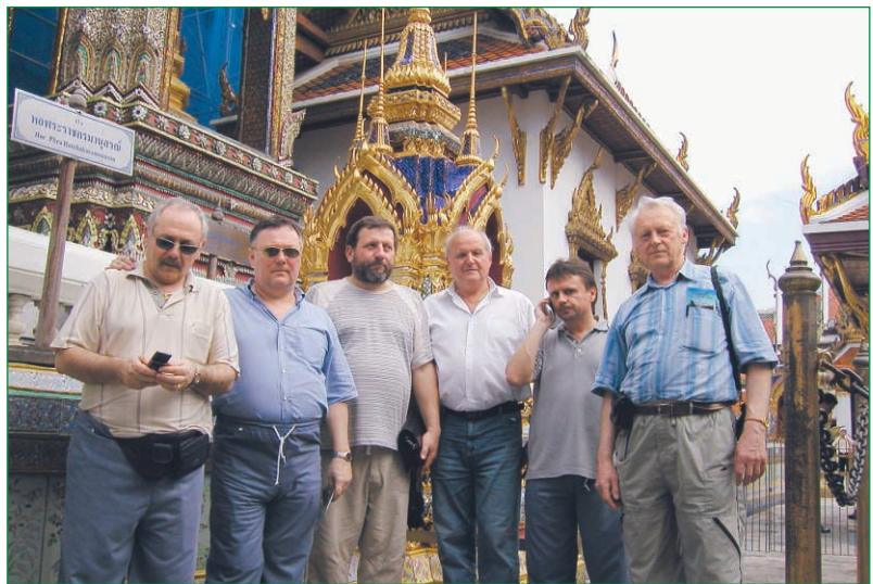
Delegácia našej univerzity v kolorite typickom pre exotickú krajinu.