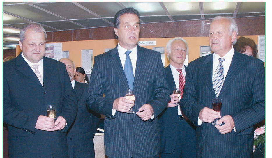
„Mesto nemôže existovať bez spolupráce s univerzitami,“ zdôraznil na stretnutí primátor Nitry a rektori našich univerzít.