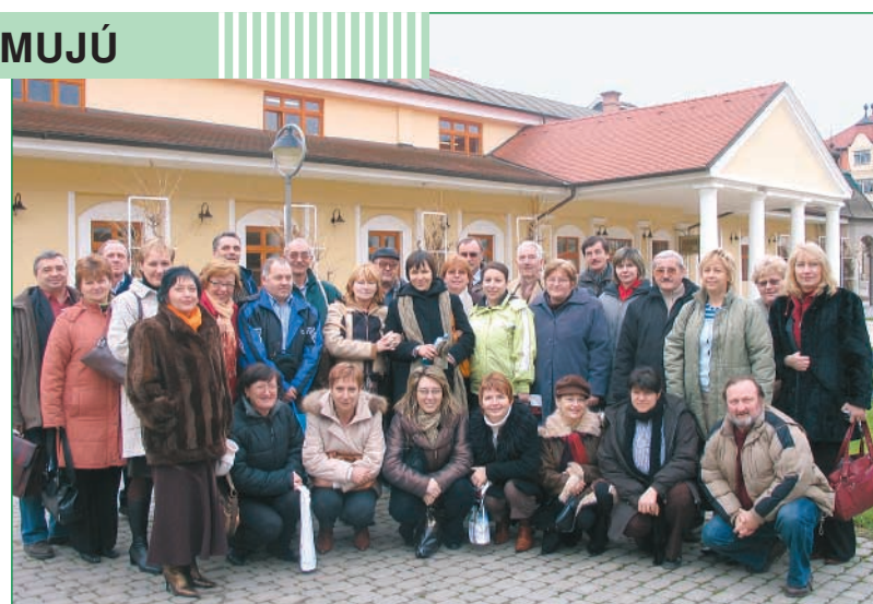
Kúpeľnú ambulanciu liečbu v Piešťanoch, zameranú na regeneráciu organizmu, absolvovalo 38 zamestnancov a dôchodcov SPU.