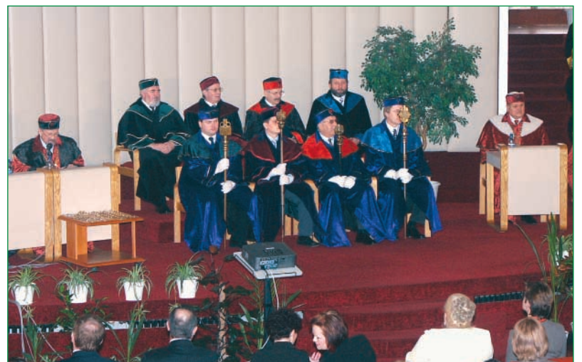
Za prítomnosti akademickej obce a hostí si novozvolené spektakulárnosti prevzali dekanové reťaze, symboly svojich fakúlt.