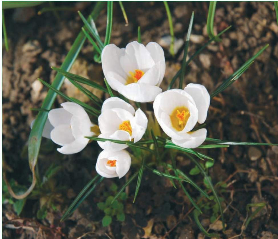
Podľa kalendára ešte zima, podľa poslov už jar...