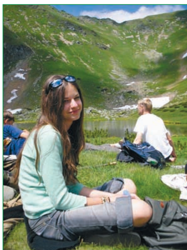
Na Račkových plesách.

V starovekých gréckych Aténach sa deti z bohatých rodín vzdelávali a učili dobrým mravom u súkromných učiteľov. Každé dieťa ochraňoval, vychovával a do školy viedol otrok, ktorého volali paidagógos (doslova: pais – chlapec, agó – vedom). Paidagógos sa neskôr v Ríme nazýval výrazom paedagogus. A to je už len skok k dnešnému pedagógovi, pedagogikovi. (K. Dašková: Slová z dovozu)