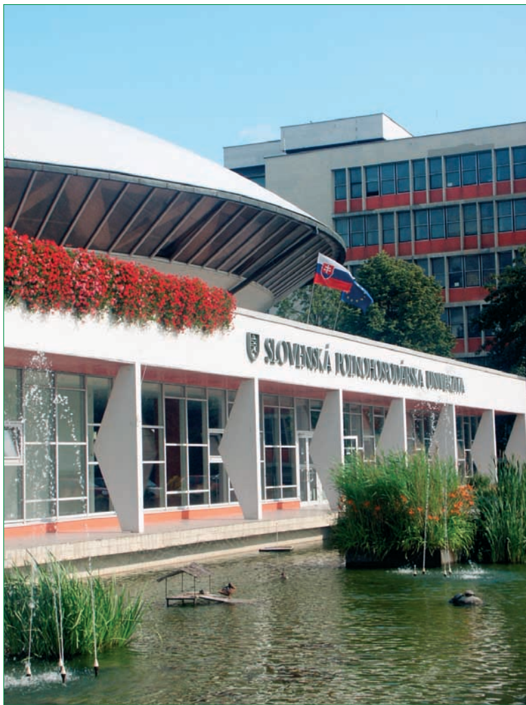
Gaudeamus igitur... Nech žije škola, nech žijú profesori, nech žijú všetci jej členovia, nech stále previtajú!