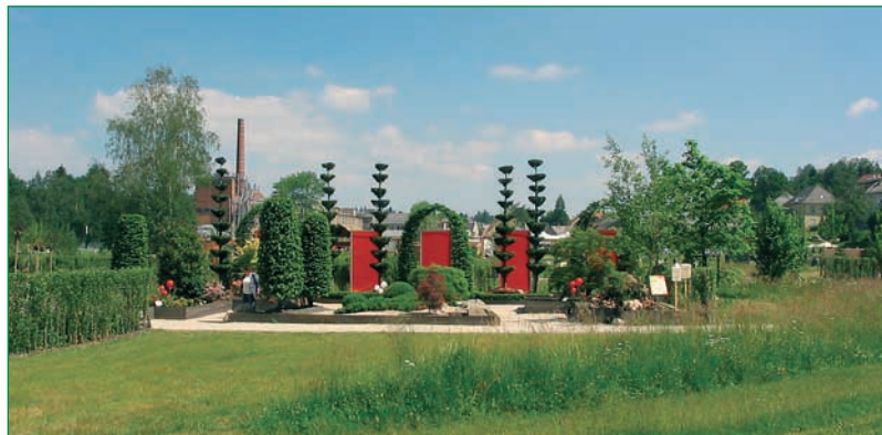
Českí a nemeckí krajinní architekti vytvorili v pohraničnom území medzi Chebom a Marktredwitzom čarovné zákutia.

Výstava v Marktredwitz je situovaná pozdĺž 200 m dlhého jazera a priľahlej rieky. Vodu tu možno pozorovať v rôznych podobách v tečúcej aj v tryskajúcej podobe v prírodnom prostredí lužného lesa. Na jazere si môžete vyskúšať kompu, ktorú poháňate bicyklovaním, teda energiou z vlastného pohonu, sú tu vybudované aj hry na riečke s použitím vlastnej energie pre deti aj pre dospelých, štylizované kvetinové záhony letničiek a trvaliek, úpravy hrobov,