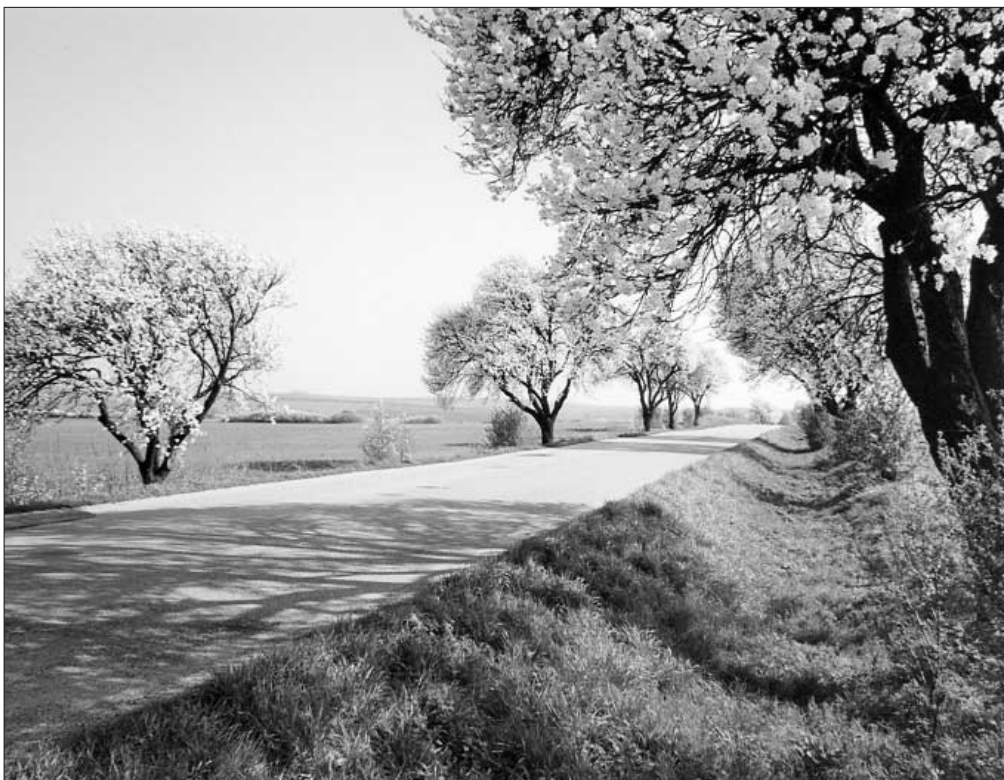
Všetky zmysly kážu: spomal tempo a odchýľ okno, krása prebúdajúcej sa prírody za to stojí!