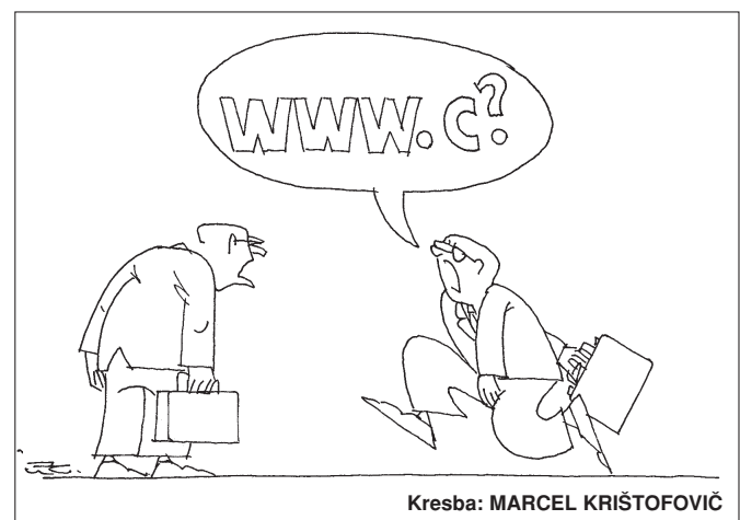
Kresba: MARCEL KRÍŠTOFOVIČ