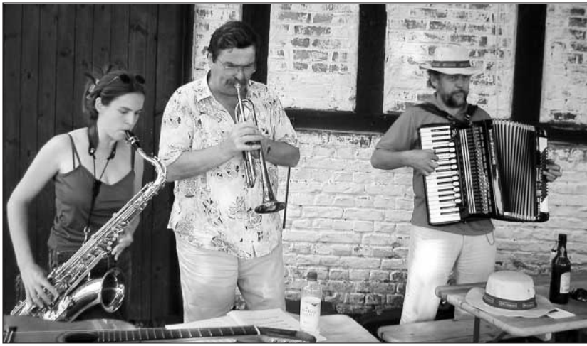
„Oči, oči, čierne oči“ pre saxofón, trúbku a akordeón.