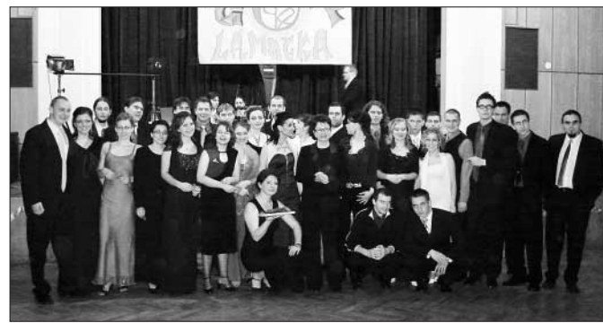
Bodaj by nebolo veselo, veď polovicu štúdia už majú šťastne za sebou...