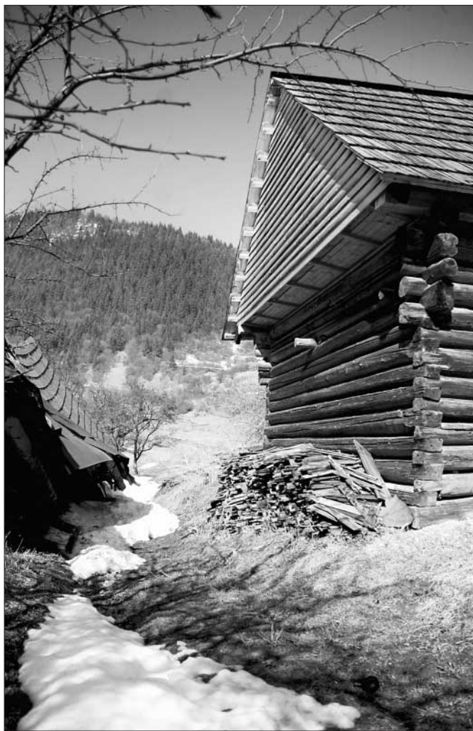
Jar už netrpezlivo prestupuje na priedomí!