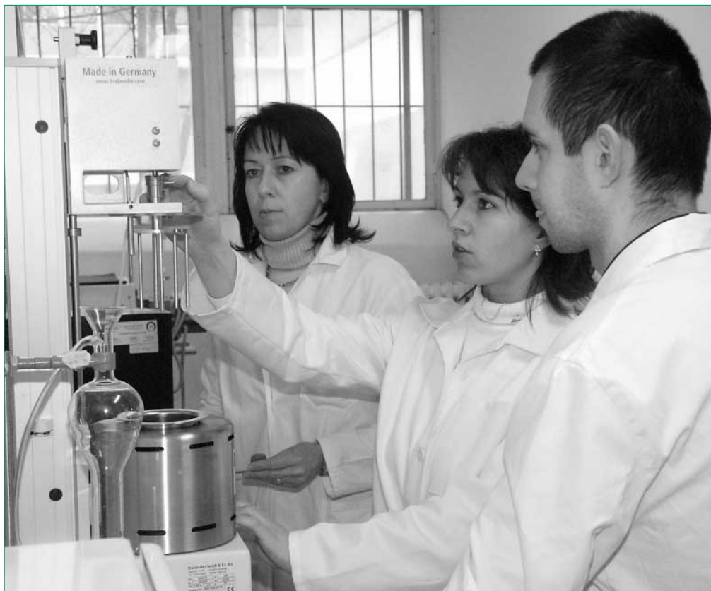
V priestoroch Katedry skladovania a spracovania rastlinných produktov Fakulty biotechnológie a potravinárstva bolo 6. februára oficiálne otvorené budujúce sa referenčné reologické laboratórium. Blížšie informácie si prečítate v budúcom čísle Poľnohospodára.

Vedenie SPU v Nitre schválilo s účinnosťou od 1. februára 2006 ceník za používanie elektrospotrebičov v študentskom domove Mladosti (časť veža). Za používanie laptopu zaplatia ubytovaní študenti 50 Sk za mesiac, za elektrickú kanvicu, televízor, DVD, video a chladničku 90 Sk za mesiac, pričom uvedené spotrebiče sú povolené iba v energetickej triede A. Záujemcovia získajú zmluvu na ubytovacím oddelení ŠD. Zároveň musia predložiť potvrdenie o type a výrobnom čísle používaného spotrebiča.