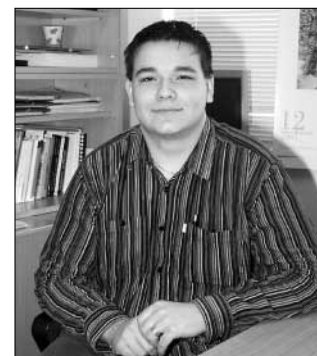
Miro už „riskoval“ aj „pokúšal“. Čo to bude do tretice?