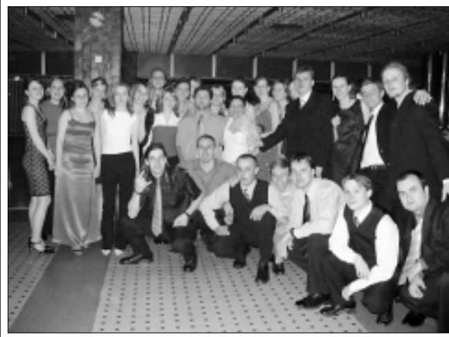
Tak sme to zlomili...