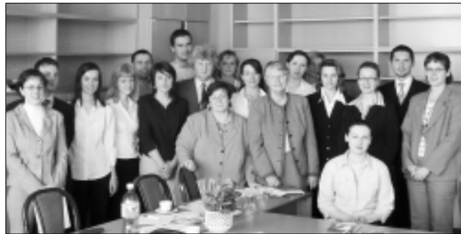
Vítazi prvého fakultného kola ŠVK na Fakulte európskych štúdií a regionálneho rozvoja so svojimi pedagógmi.

rozvoj, podnikanie a ochranu spotrebiteľa, právne a ekonomické postavenie samosprávnych krajov, vplyv malých a veľkých podnikov na ekonomický rozvoj regiónov a obcí, ako aj možnosti využitia hydroenergetického po-