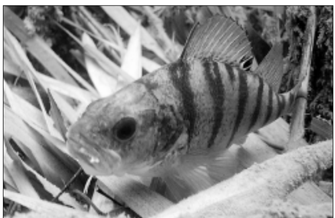
Ostriež patrí k najznámejším sladkovodným rybám v Európe. Zvyčajne žije v krdľoch a číha na drobné ryby, červy alebo larvy hmyzu, ktorými sa živí.

Meno Jánosa Selyeho sa spája s teóriou stresu. Okrem toho venoval zvýšenú pozornosť chorobe našej doby - srdcovému infarktu. Za teóriu stresu bol takmer 10 rokov nominovaný na Nobelovu cenu, ktorú mu nakoniec neudielili. Dotkol sa mnohých odborov medicíny, čo spôsobovalo problémy pri udelení tohto prestížneho ocenenia. János Selye, jeden z najvýznamnejších vedcov 20. storočia, zomrel 20. októbra 1987 v Montreali. -r-