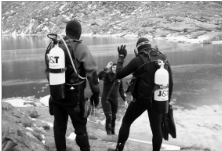
„Všetko v poriadku. Ide sa dolu!“, hovoria gestá žabích mužov. Viac o potápačoch z klubu Modrá zóna na www.bluezone.sk