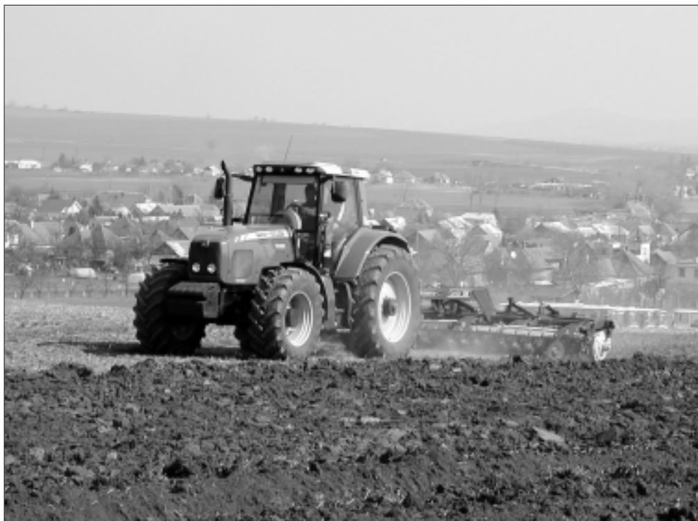
Opäť do poľ... Na jarné práce bol zameraný aj celoslovenský Deň poľa, ktorý 31. marca v Zbechoch zorganizoval Agrión – združenie výrobcov a predajcov pôdohospodárskej techniky v SR, už tradične s masmediálnou podporou Roľníckych novín. Odporúčame špecializovanú prílohu v 14. čísle tohto týždenníka.

Zdá sa však, že tu kážem vodu a nikdy nezablúdím do reštaurácie so žltá-červeným logom. Veru som si na londýnskom letisku pred odletom domov sadla na kávu a muffinku do jednej z nich. Popíjala som a pritom sledovala ruch okolo seba. Až do chvíle, kým si k vedľajšiemu stolíku nesadla mladá, moderne oblečená mamička s dieťaťom v kočíku. Akoby to cítilo, že je v reštaurácii, začalo mrkať a domáhať sa niečoho dobrého. Mamička ho vzala na ruky, diskretné si nadvihla módné tričko a – ponúkla mu to najprírodzenejšie a najzdravšie rýchle občerstvenie, ako len príroda vie dať. Na okraj a bez predsudkov: nebola to žena z dákej zaostalej civilizácie. Suma sumárum, nie je to ľudstvo na tom ešte tak zle, pravda? K. POTOKOVÁ