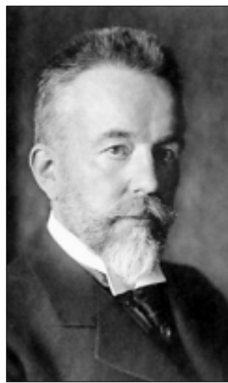
Profesor Aurel Stodola

S pozornosťou som si prečítal krátky príspevok v Poľnohospodári o najmodernejšom človeku minulého storočia, za ktorého Alberta Einsteina pasoval vedecký svet. Málkočo však vie, že obľúbeným a uznávaným učiteľom A. Einsteina bol Slováč, profesor Aurel Stodola, rodák z Liptovského Mikuláša, ktorý mnoho rokov pôsobil na slávnej Zúrišskej univerzite, kde známy fyzik študoval. Profesor Stodola bol vedec svetového mena a nositeľ Watsovej medaily, čo v tých časoch bolo viac než Nobelova cena. Zdokonalil parné turbíny natoľko, že vlastne „pochoval“ parné rušne. Jeho vynálezy, známe ako Gay-Stodolove zákony, sa dodnes využívajú pri letoch raket do vesmírneho priestoru.