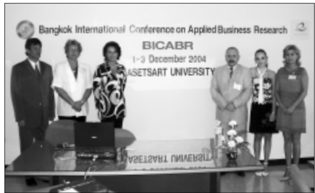
Zástupcovia Fakulty ekonomiky a manažmentu na konferencii o aplikovanom ekonomickom výskume v Bangkoku.

Kasetsart univerzita bola založená v roku 1943. Slovo „kasetsart“ v preklade znamená „vedomosti o pôde“ a vystihuje podstatu zamerania univerzity, ktorá sa vo výskume i v študijných programoch orientuje na rôzne oblasti poľnohospodárstva a príbuzných disciplín. Ak vezmeme do úvahy sedem univerzitných kampusov (z toho hlavný v Bangkoku), t.j. asi 35 tisíc študentov, je pravdou, že univerzita patrí k najväčším štátnym univerzitám v Thajsku a z hľadiska počtu študentov a geografického pôsobenia je najväčšia. Tvorí ju štrnásť fakúlt, medzi ktorými je napríklad Fakulta agropriemyslu (so študijným programom biotechnológie), Fakulta poľnohospodárstva (so študijným programom tropické poľnohospodárstvo), Fakulta lesníctva, Fakulta vodného hospodárstva a tiež noví partneri pre FEM: Fakulta ekonomiky a Faculty of Business Administration. Tá ponúka International MBA program, v rámci ktorého pôsobia prednášajúci z viacerých zahraničných univerzít. Vedenie fakulty prejavilo záujem o mobility učiteľov a študentov v rámci tohto medzinárodného programu, spoločne koordinovanie diplomových prác, orientujúcich sa na oblasť rozvoja medzinárodného obchodu a vzťahov medzi Európou a juhovýchodnou Áziou. Výsledkom rokovania dekana FEM s dekanom Faculty of Business Administration je podpísanie zmluvy o spolupráci v oblasti vedy, výskumu i vzdelávania.