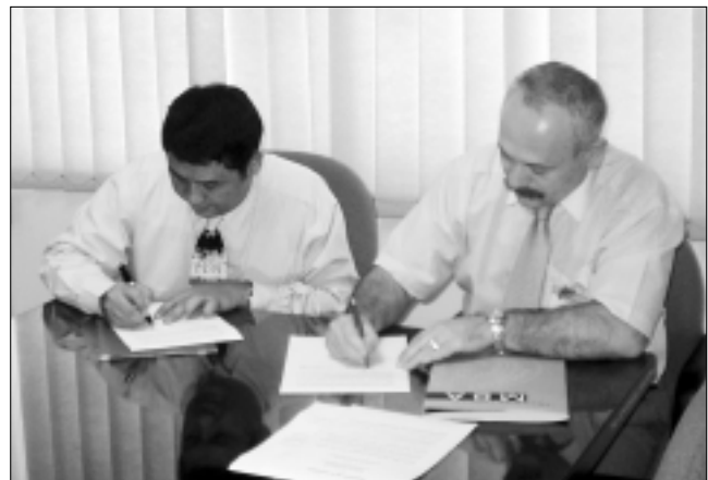
Výsledkom rokovaní bolo podpísanie zmluvy o spolupráci medzi támojšou Faculty of Business Administration a FEM SPU.

(Ďalšie zaujímavosti z pobytu delegácie FEM v Thajsku prinesieme v nasledujúcom čísle.)