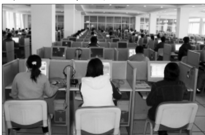
Hoci univerzita nepatrí medzi tie „high“, disponuje kvalitne vybavenou knižnicou, laboratóriami aj počítačovými cvičebňami.

Určite sú veľké kontrasty medzi životom na čínskom vidieku a v meste. Oveľa väčšie ako u nás. Aj to je motivácia pre mladých ľudí, dostať sa z vidieka do miest, kde je vyššia kvalita života. Najľahšie sa práca získava v najväčších