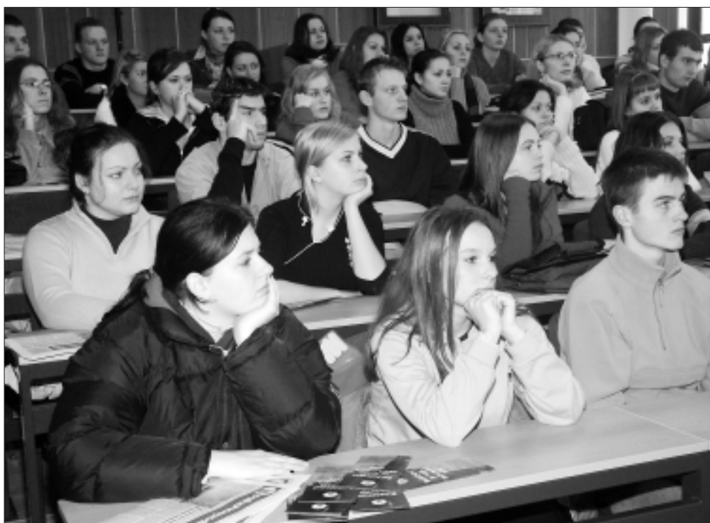
Dni otvorených dverí na fakultách patria medzi najúčinnejšie metódy propagácie študijných programov.

Premiéru v nových ekonomických podmienkach úspešne zvládlo šesť verejných vysokých škôl. V roku 2003, keď už nemali na svoju činnosť garantovaných sto percent zo štátneho rozpočtu, skončili v pluse. Naopak, záporný hospodársky výsledok vykázalo na konci roka 13 škôl. Vyplýva to zo Správy o stave vysokého školstva za rok 2003, ktorú po prvý raz v histórii vypracovalo ministerstvo školstva. Slovenská poľnohospodárska univerzita v Nitre s kladným hospodárskym výsledkom 6,66 milióna Sk je v rebríčku najlepšie hospodáriacich vysokých škôl na druhom mieste za STU v Bratislave (29,44 mil. Sk) a pred Prešovskou univerzitou (5,15 mil. Sk). (HN, 18. 1. 2005)