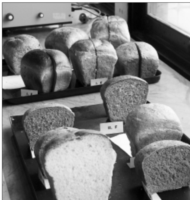
Nahradiť v bezlepkovej diéte tradičný chlieb akceptovateľnou potravínou, to je pre vedcov vážna a zodpovedná úloha.

Kladíme si otázku, prečo kukuričný prolamin, zein, ktorý má veľmi blízku chemickú skladbu ako pšeničný gliadín, nevyvoláva takúto reakciu. Vysvetlenie nachádzame jedine v konformačnom stave bielkoviny. Je to vlastne jej sekundárna štruktúra, to znamená priestorová orientácia polypeptidového reťazca. Tá môže byť pri rôznych obilninách odlišná. Konformačný stav molekuly polypeptidu môže ovplyvniť jej reak-