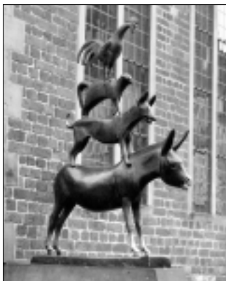
Jedným zo symbolov mesta sú aj „brémski muzikanti“ z rozprávky bratov Grimmovcov.

koškolským absolventom pôsobiacim v stredných a vysokých vedúcich pozíciách a má za úlohu pripraviť ich na úspešné pôsobenie v podnikoch a firmách s medzinárodným zastrepením.