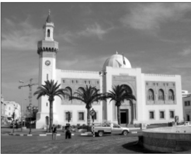
Sfax – druhé najväčšie mesto Tuniska nepatrí medzi turistické lokality a cudzinca tu stretnete iba zriedka.

V jeden večer som sedela na schodoch pred domom, kde si ku mne prisadla 14-ročná sestra mojej priateľky, u ktorej som v tom čase bývala. Celá šťastná, že jej venujem pozornosť, mi francúzsko-anglickou zmiešaninou začala vykladať svoj životný sen. S nádejou v očiach mi rozprávala o tom, ako si želá, aby Európa a všetky arabské krajiny boli ako brat a sestra, ako jedna rodina. Sedela som tam, hľadela do jej mladučkej nevinné tváre a prvýkrát v živote som úplne stratila reč. Čo ako som sa pokúšala, nenapadala mi nijaká logická