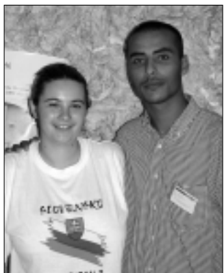
S Iskandarom, kolegom z tuniského AIESECu, som „zviditeľňovala“ Slovensko na prezentačnej výstave vzdelávacích inštitúcií v Sfaxe.

národnostné či rasové témy. Namiesto toho som objavovala ich zlaté srdcia, priateľské duše, jednoduchosť myslenia a nezištnosť ich pohostinnosti.