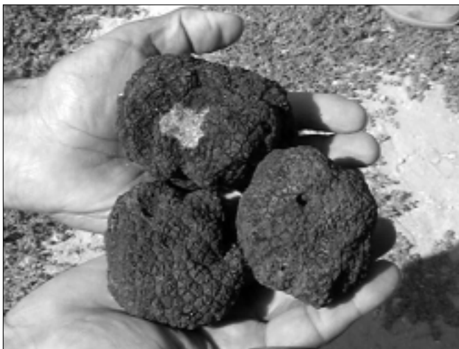
Hľuzovka letná (Tuber aestivum Vitt.)

Spočívať sa plodnice hľuzoviek zbierali iba vo voľnej prírode.