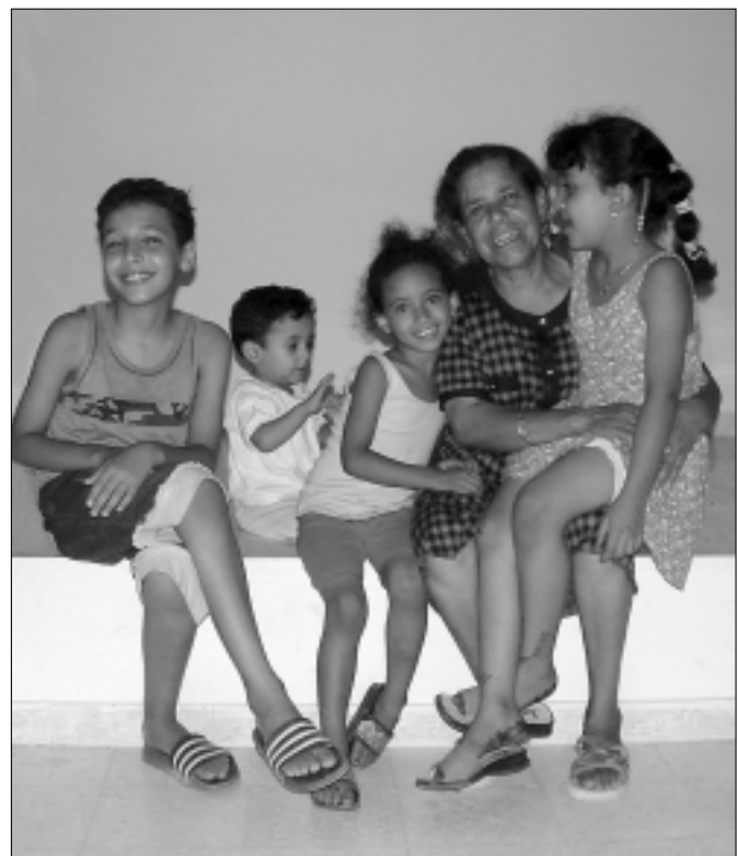
Rodinné väzby sú v arabských krajinách veľmi silné.

Snažila som sa preniknúť do chápania arabského spôsobu života, rešpektovať a oceňovať veci napriek tomu, že som ich spočiatku nechápala. Po dvoch mesiacoch sa mi už nezdalo čudné, že kaviarne sú plné mužov popíjajúcich kávičku alebo čaj s príchutou vodnej fajky, ktorú si popri tom vychutnávali. Dôvod bol prostý, ženy necítili potrebu ísť si niekam večer sadnúť do kaviarne. Ony boli šťastné aj bez toho. Uspokojovali ich diametrálne odlišné aktivity, ktoré by sa európskym ženám zdali určite banálne, alebo dokonca smiešne. Avšak život tam je o niečom inom. Tunisania investujú čas do vzájomných rodinných a medzifudských vzťahov, venujú a preukazujú svoju pozornosť priateľom. S istotou môžem prehlásiť, že hoci som precestovala Európu od Barcelony, cez Paríž a Ženevu až po Srbsko a Čiernu Horu, nikde som, napriek každo-