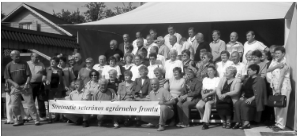
Stretávka „šesťdesiatnikov“, absolventov Prevádzkovo-ekonomickej Fakulty VŠP z rokov 1962-67.