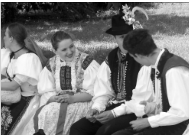
Začiatkom júla privítala naša univerzita účastníkov folklórneho festivalu Akademická Nitra.

chodnej nás čakala Akademická Nitra 2004, na ktorej sme sa zúčastnili ako účinkujúci aj spoluorganizátori. Výnikajúca atmosféra troch folklórnych večerov v DAB Nitra, ale i tá neformálna neoddeliteľne patriaca k vysokoškolskému, spolu so získaním diplomu za námet, scenár a dramaturgiu programového bloku, boli zavŕšením štvormesačného cyklu